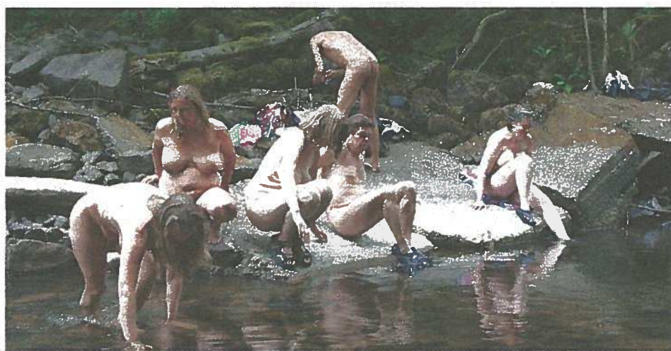
I MARKA: Ved en gammel demning på Skui, like ved Bjørumsaga møtes en gjeng på seks som spiller gitar, synger og prater.

” Enten en har for mye eller for lite, kan en være seg selv her.