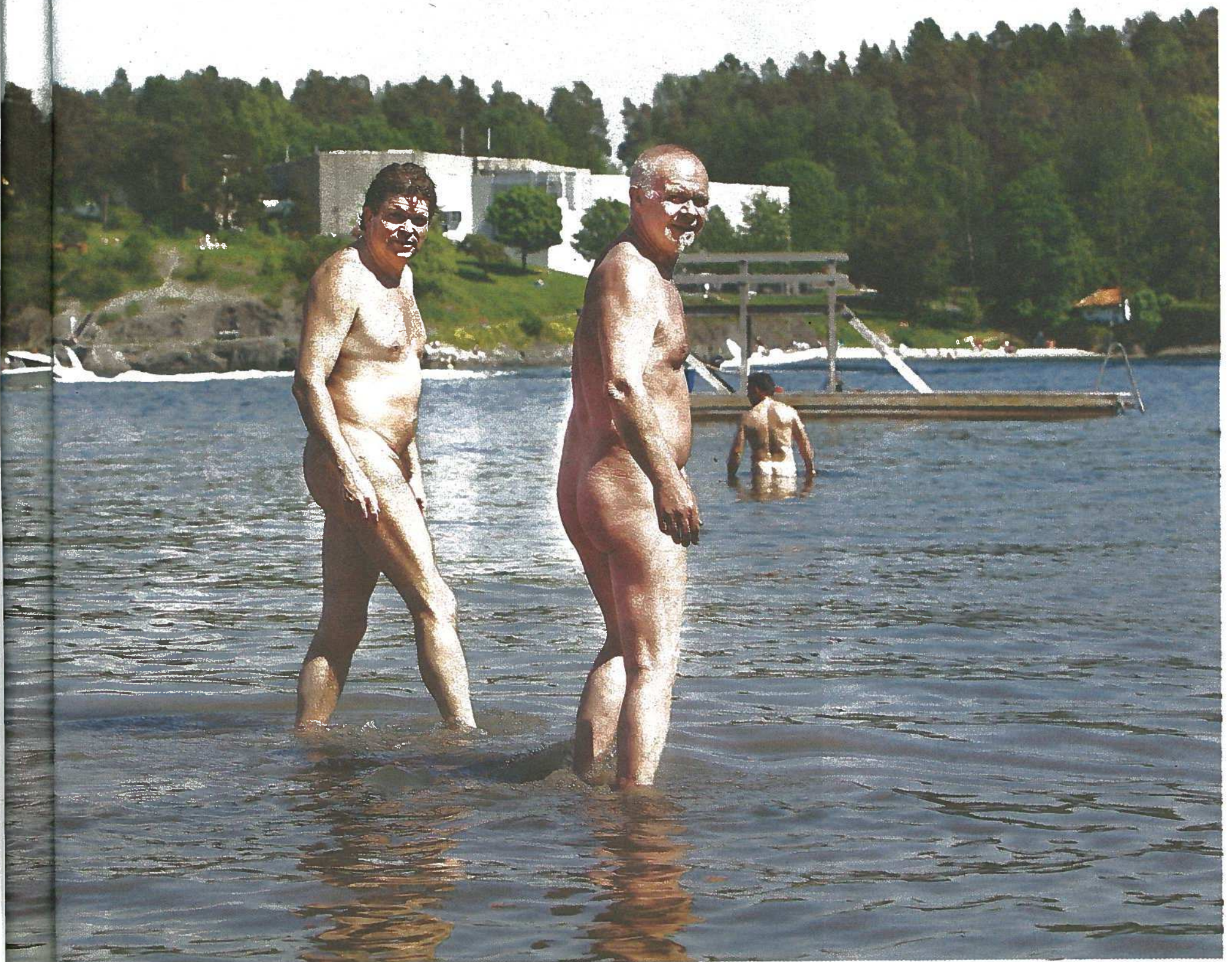
Bjerg synes ikke noe om å bade med badeshorts på. – Det er helt grusomt, mener Combee.