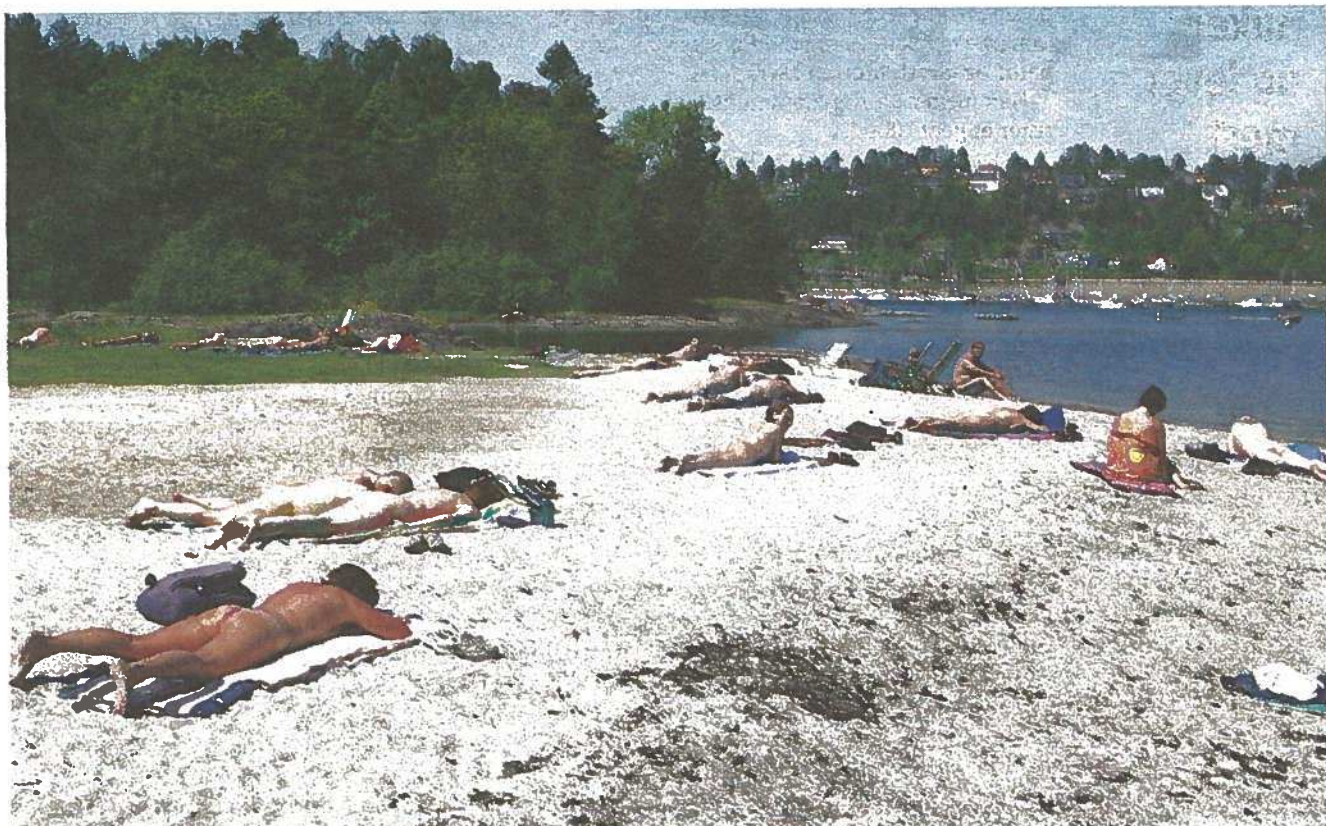
ROLIG: Stemning på stranden på Kalvøya er avslappet. Folk oppfordres til å ikke spille høy musikk, og å holde støynivået nede.