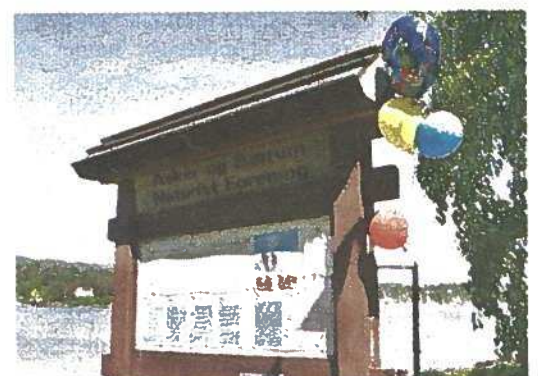
FEIRER 30 ÅR: Asker og Bærum har den nest største naturistforeningen i landet.