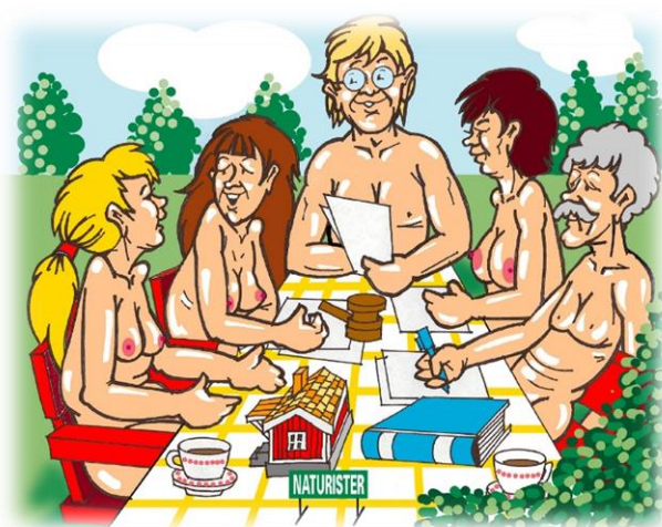
Teckning: Börje Fransson

Vi ska också som vanligt välja två revisorer och en revisorssuppleant på vardera ett år samt förstås en valberedning på tre personer.