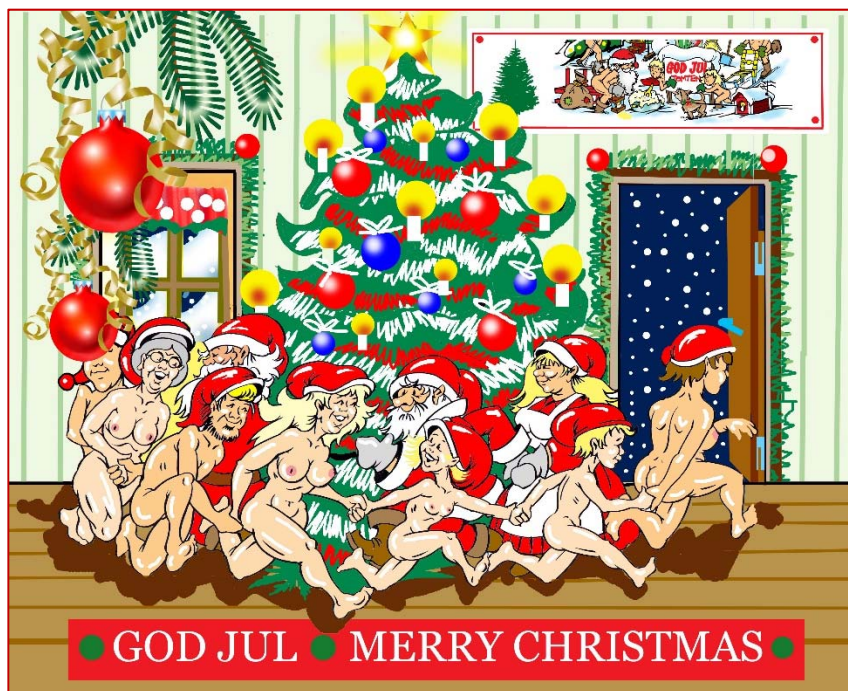
Teckning: Börje Fransson

Styrelsen jobbar på även under vintern fast med lite färre sammanträden än under sommaren.