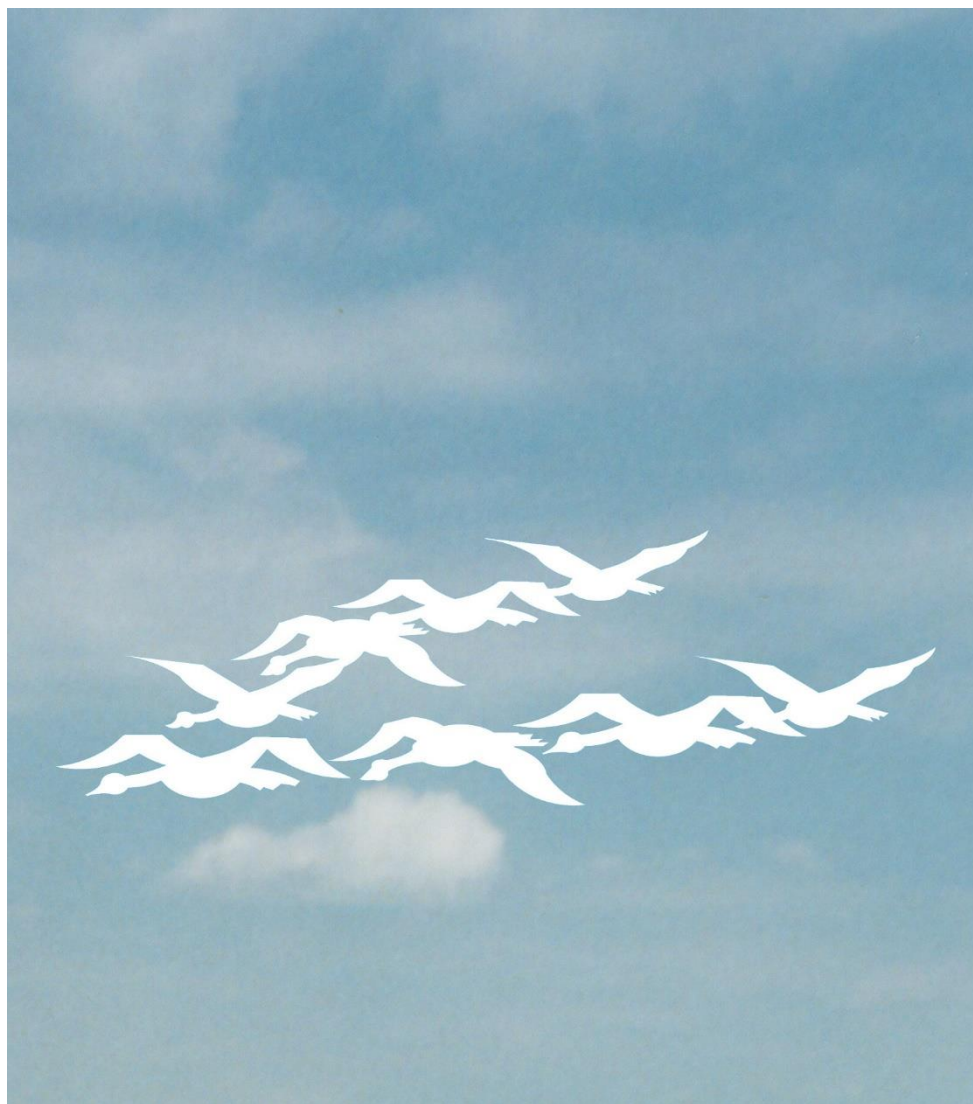
Teckning: Börje Fransson

Vi hälsar våra sex nya säsongare under 2021 varmt välkomna till oss. År 2022 tillkommer också två säsongare som vi också hälsar välkomna.